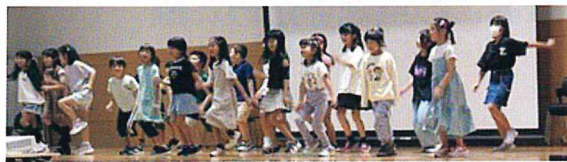
手話サークル パピヨン