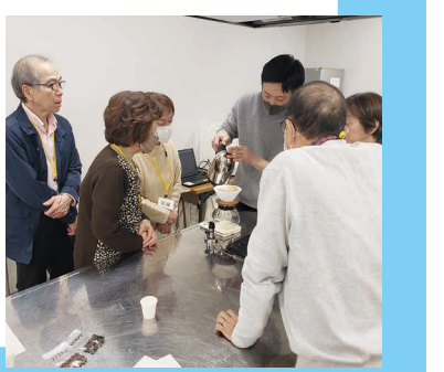
【おいしいコーヒーの淹れ方講座】の様子

今後も地域の皆さんが参加したくなるような講座等を開催し、ボランティア活動を盛り上げていきたいと思っています。関心のある方はぜひご参加ください。