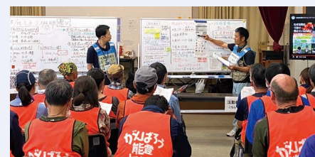
災害ボランティアセンターの活動の様子

川西市社会福祉協議会は、地域の皆様と一緒に「ほっとかへん つなげる・つながる おてつだい」を目指して、まちづくりに取り組んでいます。