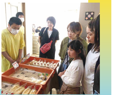
【ひだまり】2号店での活動の様子