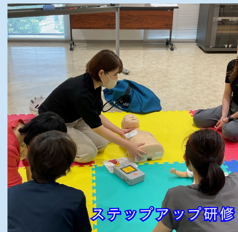
ステップアップ研修