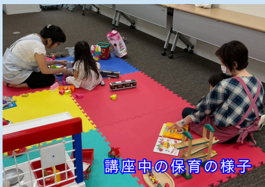
講座中の保育の様子

サポート中の事故に備えて救急 救命の方法を学びました。5年 毎に更新が必要です。